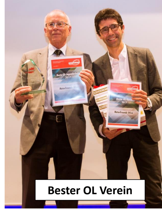
Bester OL Verein