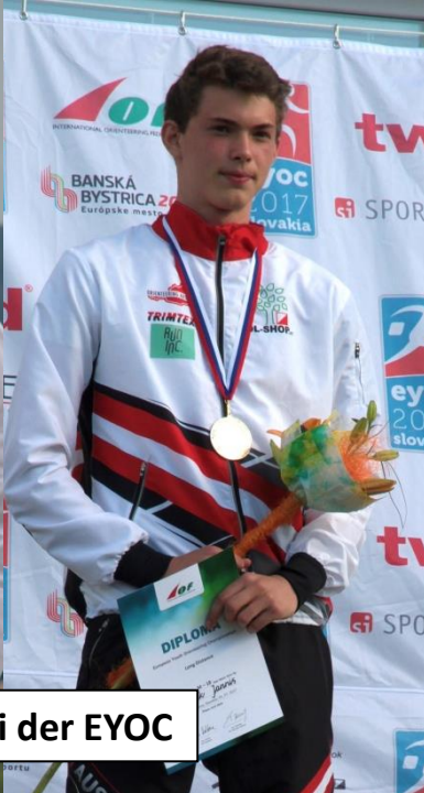
Medaillen und Diplome bei der EYOC