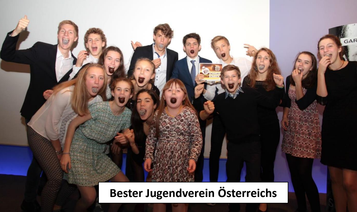
Bester Jugendverein Österreichs